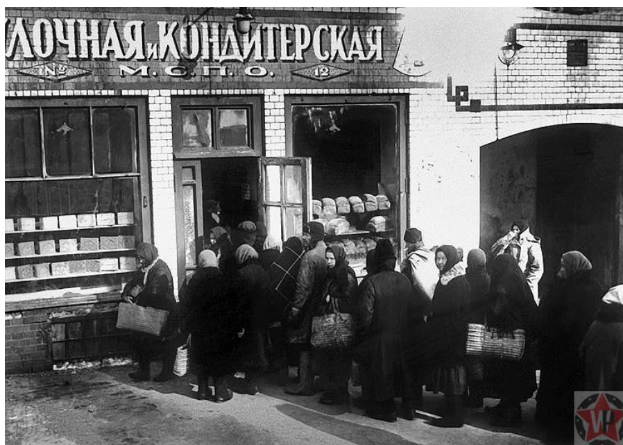
Ленинградцы в очереди за продуктами.

Тем временем положение в городе становилось всё хуже. По сути, оно дошло до критической отметки, перешагнуло её и уверенно двинулось дальше. Продовольствия катастрофически не хватало. На начало осады в городе находилось приблизительно 2,9 миллиона человек. Каких-то сколь-нибудь значительных запасов продуктов в Ленинграде не было. Он функционировал за счёт продукции, поставляемой из ленинградской области.