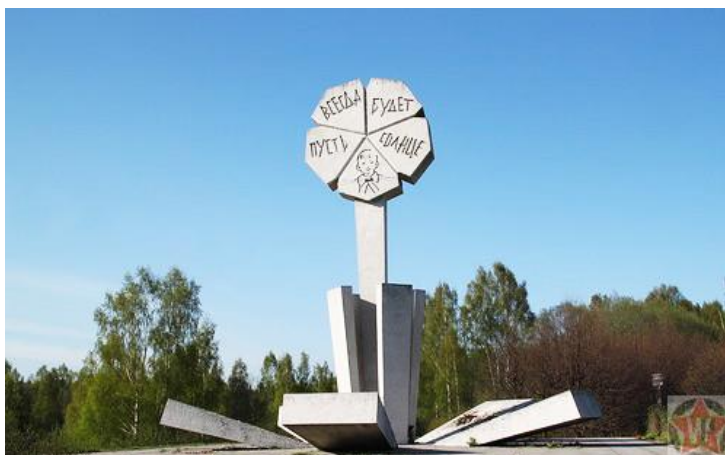
Памятник «Цветок жизни» на «Дороге жизни»