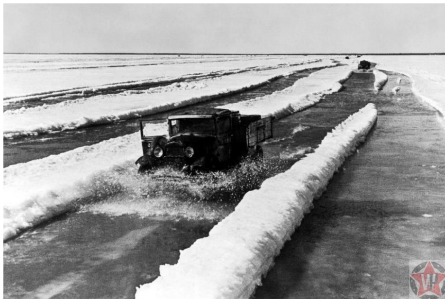
Военно-автомобильная дорога № 101

В документах она именовалась военно-автомобильной дорогой № 101. На каждом пятом километре трассы должны были находиться пункты обогрева. А саму дорогу планировали делать в 10 метров шириной. Но в реальности всё было намного сложнее, чем на бумаге. При том, что проходила Дорога жизни, как её прозвали сами ленинградцы, по местам наименьших глубин, нередко лёд проламывался, забирая не только ценный груз, но и немало человеческих жизней.