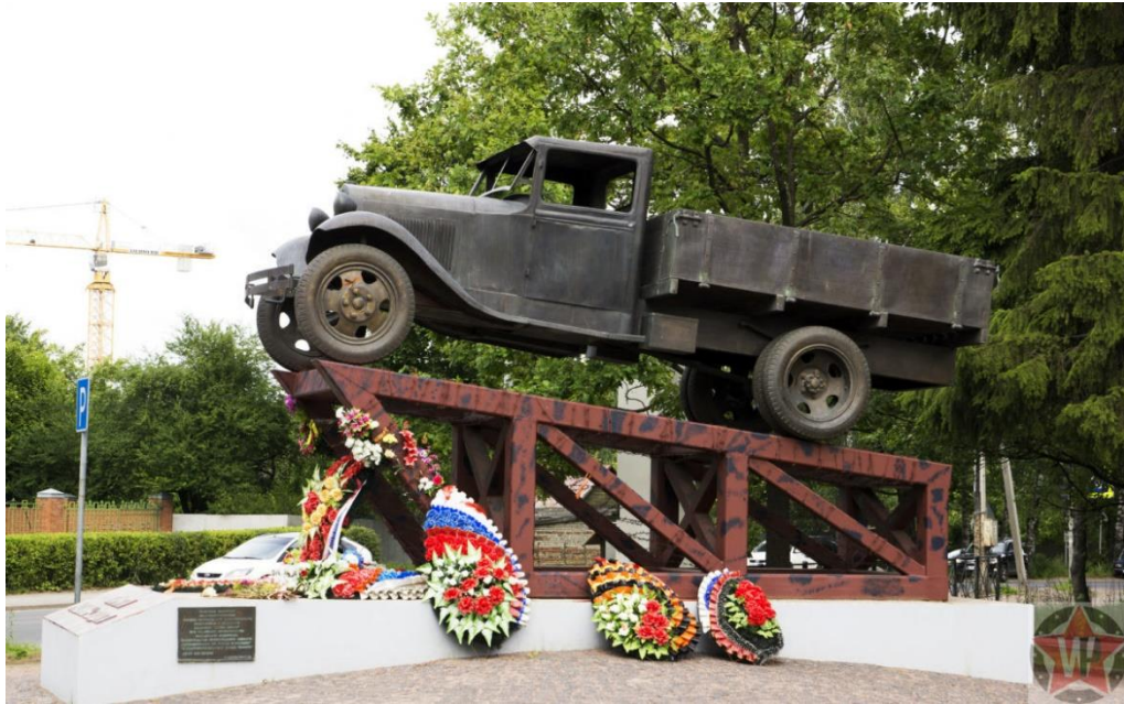
Памятник «Полторка» на «Дороге жизни»