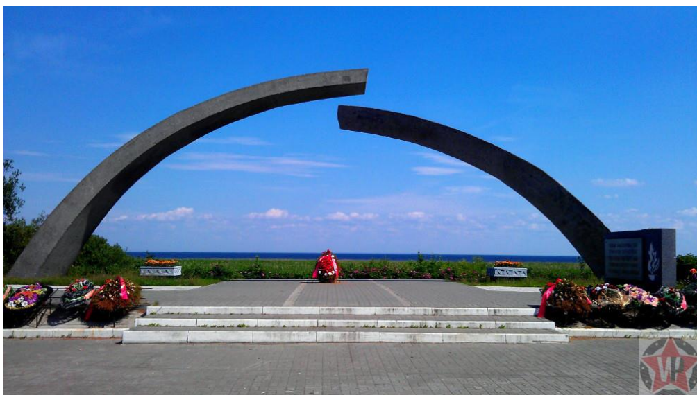
Памятник «Разорванное кольцо» на «Дороге жизни»