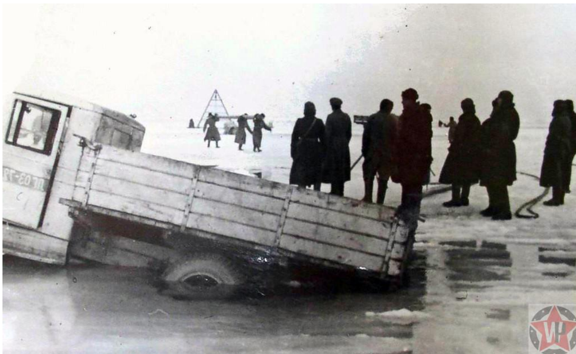
Тонущие машины на «Дороге жизни».

Однако опасности этим не исчерпывались. Немцы старались наносить авиаудары по колоннам во время перевозок грузов. Они целились как по самим грузовикам, так и по дороге следования, стремясь разрушить саму трассу. Капризная погода тоже практически атаковала ладожскую военную дорогу. Поднявшаяся метель быстро уравнивала проложенную по льду дорогу с окружающим нетронутым пейзажем. Была крайне велика опасность сбиться с пути. Немало водителей погибли от холода, заблудившись в метель. Для предотвращения таких случаев на протяжении трассы было установлено множество дорожных знаков.