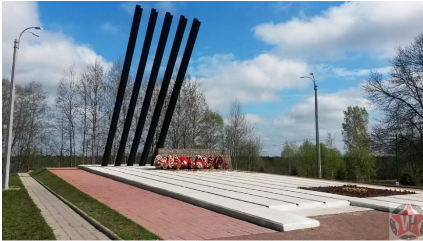
Памятник «Катюша» на «Дороге жизни»