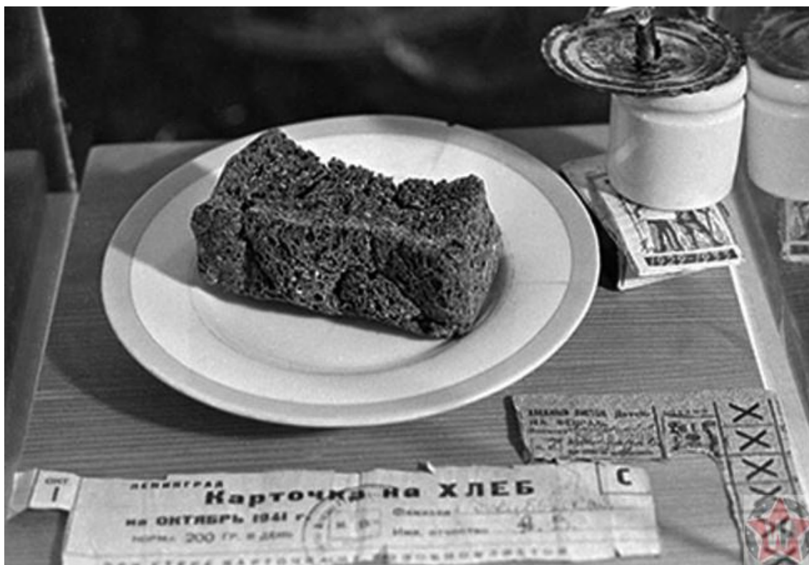
Карточка на хлеб

И не стоит забывать, что эти 125 грамм были не хлебом из чистой муки, пускай и низшего сорта. В хлеб добавляли всё, что могло быть съедобным – пищевую целлюлозу, жмых, обойную пыль, выбойки из мешковины. Было ещё понятие коревой муки. Она образовывалась из промокшей, схватившейся и затвердевшей, словно цемент, корки. По дороге в Ленинград немало машин тонуло вместе с продовольствием. Специальные бригады под покровом темноты разыскивали эти места и, с помощью веревок и крючьев, поднимали со дна мешки с мукой. Какая-то часть в самой середине могла остаться сухой. А остальная мука превращалась в твёрдую корку, которую потом разбивали и добавляли в блокадный хлеб.